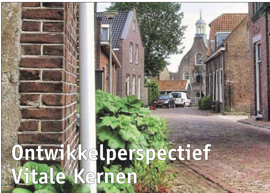
foto is uit de Ontwikkelperspectief Vitale Kernen van Gemeente Nissewaard