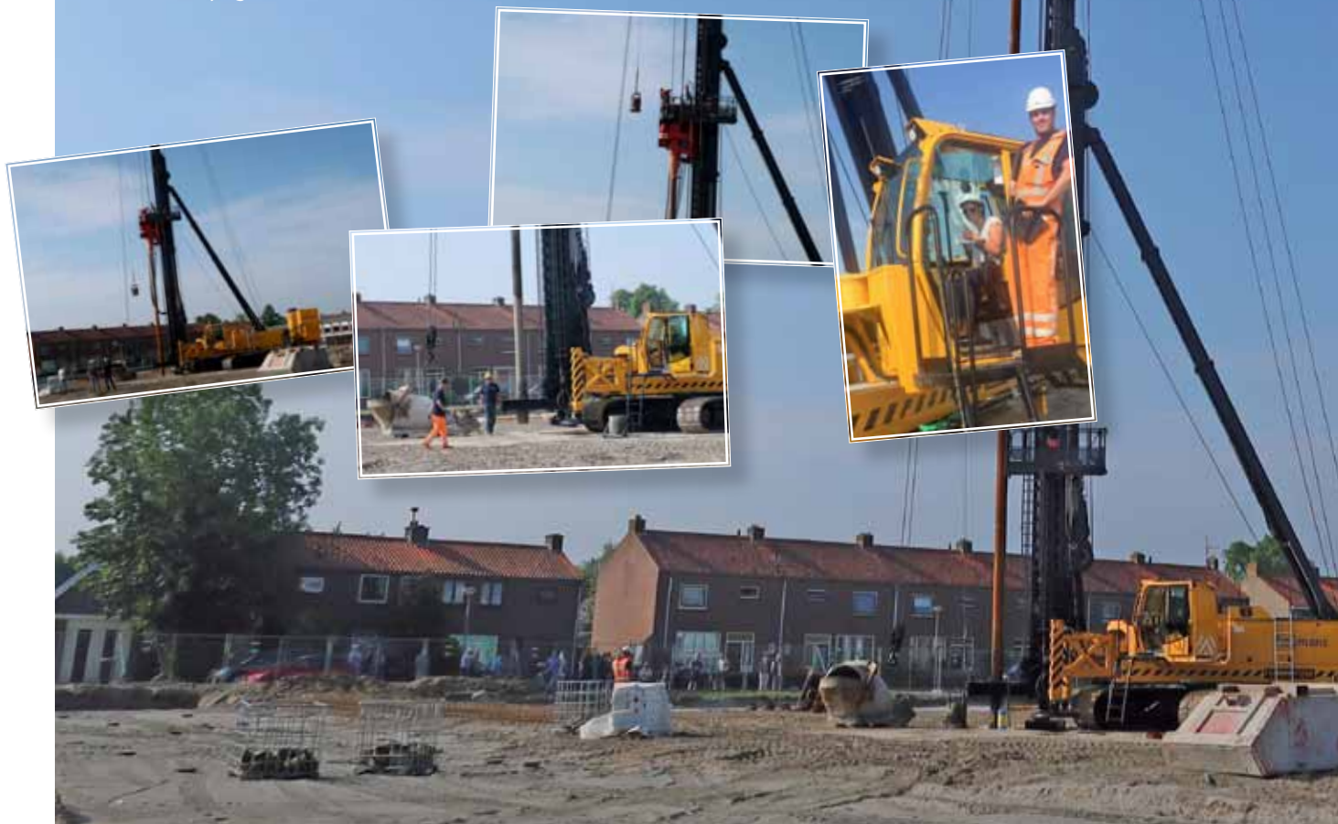
BLOK 1 BeBo woningen

Vanwege het Coronavirus kon met de kopers en betrokken partijen ter plaatse geen 'eerste-paal' feestje worden gevierd. Daarom hebben we voldoende beeldmateriaal gemaakt om te delen. Kijk voor de foto's en een video op onze Facebookpagina of onze website.